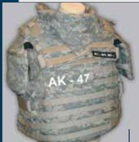
Tac TOP Modell: Ttop