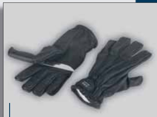
Modell: Rg104 C

Egy meleg, száraz kesztyű a legszélsebésebb hidegekhez. Dyneema® belső bélése kiválóan véd a vágások ellen.