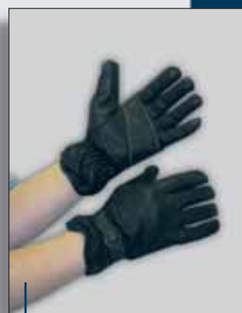
Modell: Rg104 B