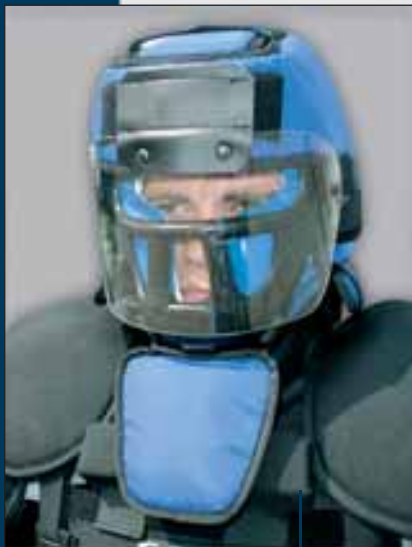
Modell: The05 (fél arcvédő)