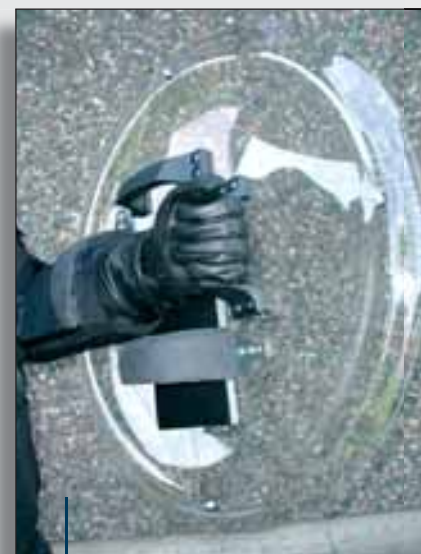
Modell: Rs 065

Tűzálló Nomex tömegoszlató overál, melyet a C.P.E. védelmi felszerelésekhez terveztünk. Egyedülálló kialakításának köszönhetően gyorsan és könnyen felölthető.