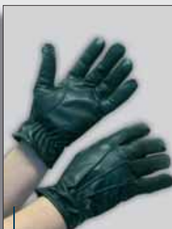
Modell: Rg104 A