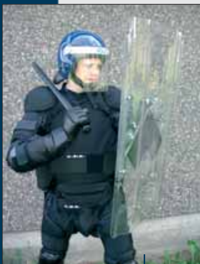
Modell: Rs 100/120/ 165/195